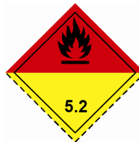
(Nr. 5.2) Symbol (Flamme): schwarz oder weiß auf rotem (obere Hälfte) und gelbem Grund (untere Hälfte); Ziffer «5.2» in der unteren Ecke