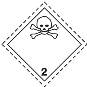
(Nr. 2.3) Giftige Gase Symbol (Totenkopf mit gekreuzten Gebeinen): schwarz auf weißem Grund; Ziffer «2» in der unteren Ecke