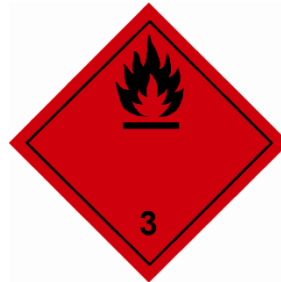
(Nr. 3) Symbol (Flamme): schwarz oder weiß auf rotem Grund; Ziffer «3» in der unteren Ecke