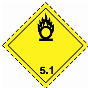
(Nr. 5.1) Symbol (Flamme über einem Kreis): schwarz auf gelbem Grund; Ziffer «5.1» in der unteren Ecke