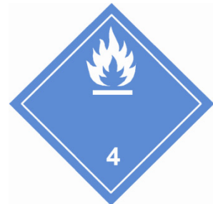
(Nr. 4.3) Symbol (Flamme): schwarz oder weiß auf blauem Grund; Ziffer «4» in der unteren Ecke