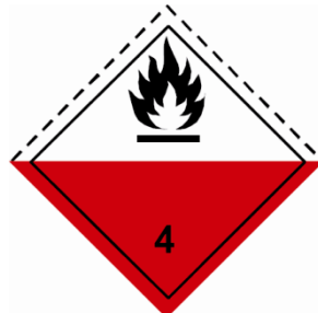
(Nr. 4.2) Symbol (Flamme): schwarz auf weißem (obere Hälfte) und rotem Grund (untere Hälfte); Ziffer «4» in der unteren Ecke