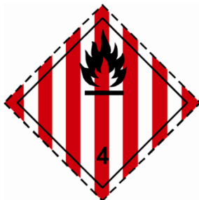
(Nr. 4.1) Symbol (Flamme): schwarz auf weißem Grund mit sieben senkrechten roten Streifen; Ziffer «4» in der unteren Ecke