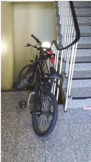
Abb. 4: Verstelltes Treppenhaus

So sind angekettete Fahrräder am Treppengeländer, Schuhschränke vor den Wohnungstüren oder großblättrige Pflanzen auf den Treppenabsätzen und im Treppenhaus keine Einzelfälle.