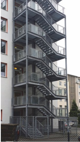
Abb. 2: Außentreppe

Die Wände notwendiger Treppenräume müssen als raumabschließende Bauteile nach MBO